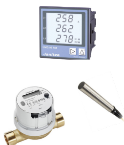
Sensoren & Messgeräte