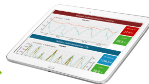
Echtzeitdaten, Kennzahlen & Berichte